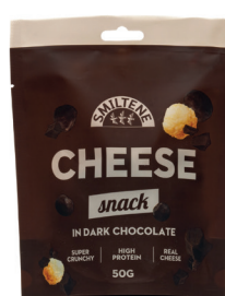
SIERA KRAUKŠKI AR TUMŠO ŠOKOLĀDI 50g