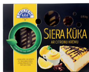
SIERA KŪKA AR CITRONU KRĒMU 950g