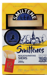
SMILTENES SIERS 40% Premium 250g