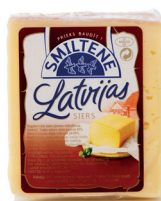
LATVIJAS SIERS 45% fasēts