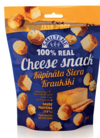
SIERA KRAUKŠKI KŪPINĀTA SIERA 60g