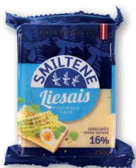
LIESAIS SIERS 16% 250g