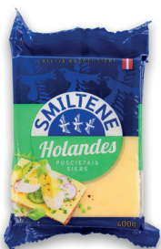
HOLANDES SIERS 45% 400g