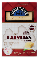
LATVIJAS SIERS 45% Premium 250g