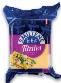
TILZĪTES SIERS 45% 400g