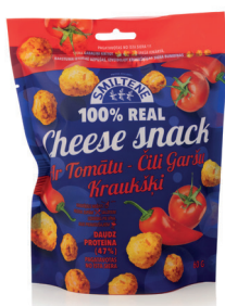
SIERA KRAUKŠKI AR TOMĀTU-ČILĪ GARŠU 60g