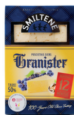
GRANISTER SIERS 50% Premium 250g