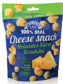
SIERA KRAUKŠKI HOLANDES SIERA 60g