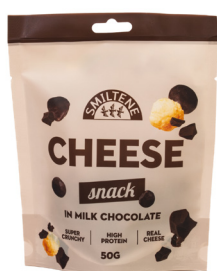
SIERA KRAUKŠKI AR PIENA ŠOKOLĀDI 50g