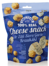
SIERA KRAUKŠKI AR ZILĀ SIERA GARŠU 60g