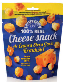
SIERA KRAUKŠKI AR ČEDARAS SIERA GARŠU 60g